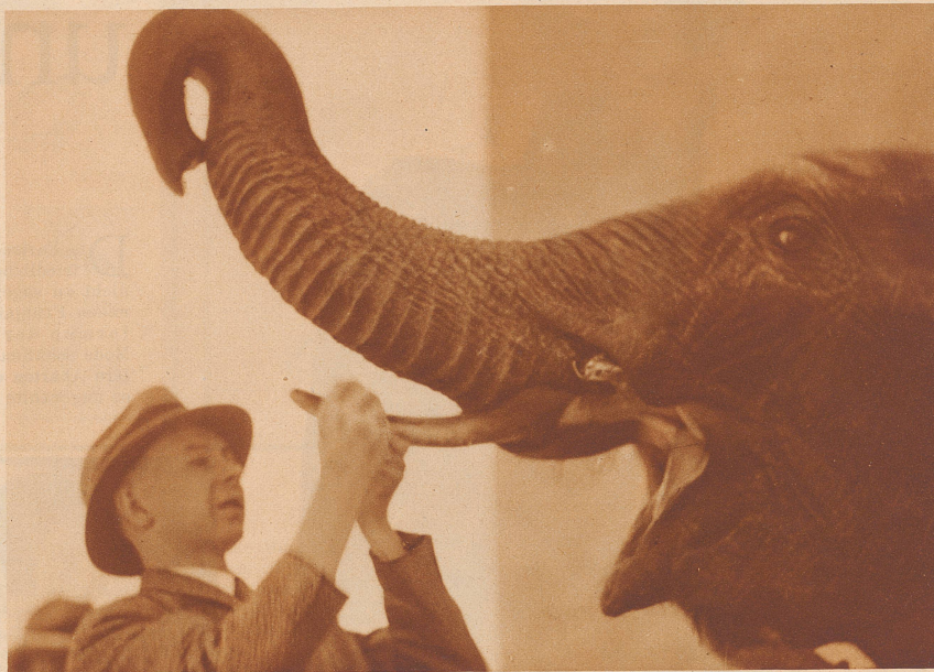
Der arme Chang hat nur noch einen einzigen Elfenbeinzahn, der andere ist abgebrochen, als Mandjula den Chang in einen Graben warf. Der Zahn wird in fünf Jahren wieder ziemlich nachgewachsen sein