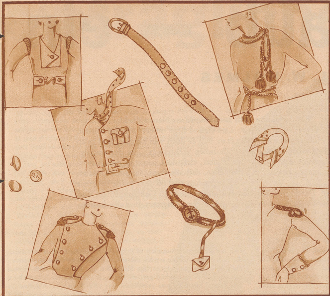
Was es schon gibt . . . . .