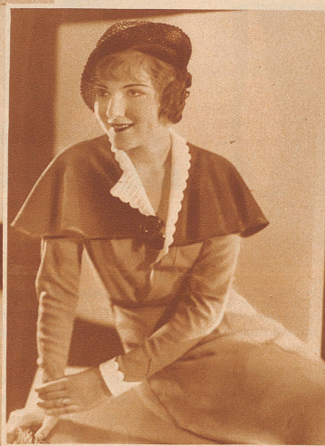
Graues Frühjahrskleid mit rotem Cape und Hut; weiße Blenden an Ärmel und Kleidausschnitt. — Das Cape soll die gewünschte Modelinie der breiten Schultern hervorbringen. Wattierte Achseln und Oberarmkugeln sind dieses Jahr keine Seltenheit!

geflochtenen Woll- oder Baumwollstoffen geben. Die meisten davon sind doppelreihig, mit Gold- oder Silberknöpfen geschlossen. Besonders bei den kurzen in die Taille geschnittenen Jäckchen mit den glänzenden Knopfreiheiten taucht automatisch das Bild eines Leutnants der alten österreichischen Armee auf. Vielleicht hat hier der Film mit seinen vielen feschen Phantasie-Leutnants auf die Mode-Gestalter gewirkt. — Die Knopfreiheiten wiederholen sich reichlich an den Kleidern; der linke oberste Knopf, der fast an der Schulter sitzt, kann auch geöffnet werden, so daß dadurch ein richtiger Revers entsteht.