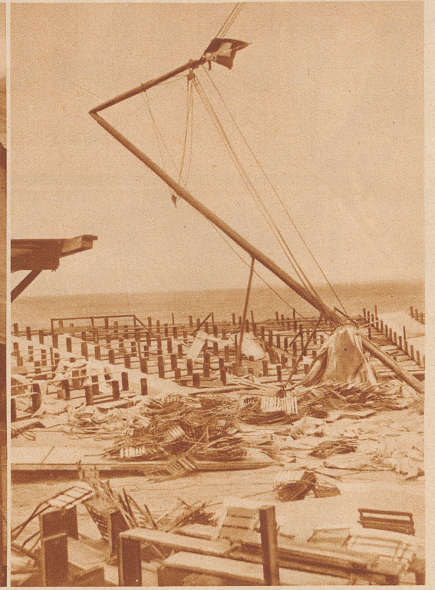
Der geknickte Hauptmast und das Chaos im Zuschauerraum