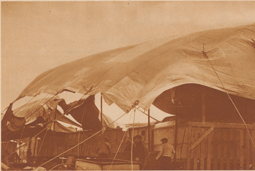
Der Sturm im Menagerie-Zelt

Am 5. April wurde in Rorschach das große Zelt des Zirkus Knie durch einen gewaltigen Föhnsturm vollständig zerstört. Menschen und Tiere kamen bei der Katastrophe heil davon, der Materialschaden beträgt rund 40 000 Franken. Aufnahmen Labhart