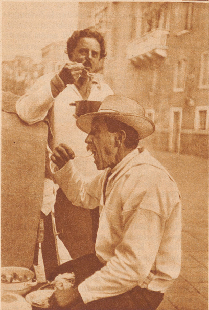
Gondolieri nähren sich ausschließlich von Spaghetti – so glaubt der begeisterte Fremde, so wie er glaubt, daß die Bergler jahraus, jahrein immer jodeln. Aber Gondolieri lieben sicher die Abwechslung auf dem Tisch