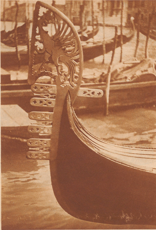
Das schönste «Ferro», das ich in Venedig fand