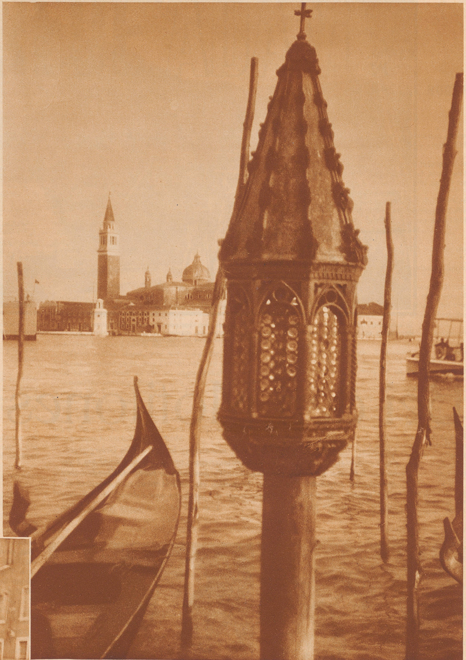
Immer noch stehen am Molo die reizenden spätgotischen Lichthäuschen