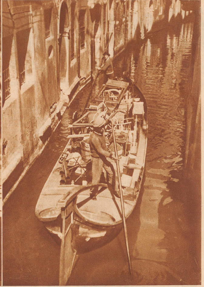
Umzug - nicht mit dem Möbelwagen, sondern mit der Gondel