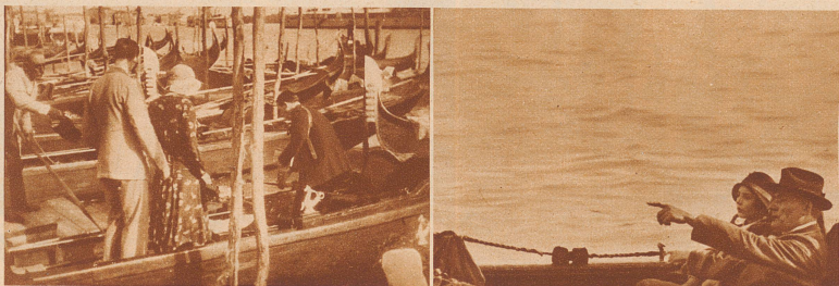
Hochzeitsreise . . . .