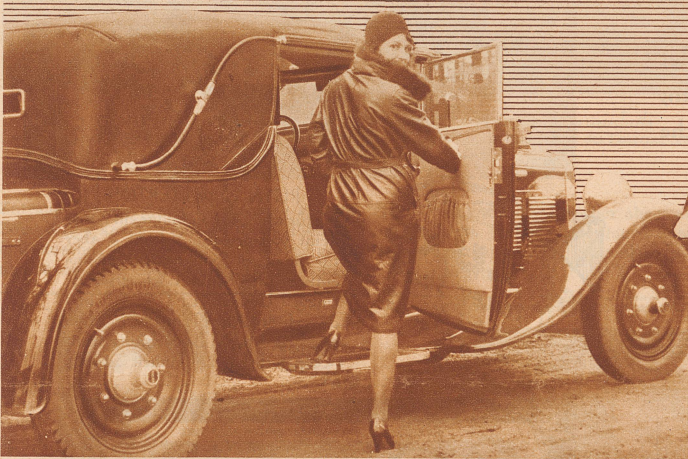
Mit Lindt ist man immer in guter Gesellschaft

Als der Riese Palü kam, und nach Böögg fragte, machte sie nur: «Pist, pist, s'Baby schloft.» Dann drückte sie einem großen Faß Most den Boden ein, und reichte es dem Besucher zum Willkommen. Der trank es schnell aus, und ging wieder. Das Riesenbaby war ihm so in die Knochen gefahren, daß er gar nicht abwartete bis der Vater heimkam. Beschämt zog er sich über die Berge zurück und fristete hinfort, als kleiner Riese, ein trauriges Dasein. — Den Riesen Böögg aber führt man noch heute durch die Straßen von Zürich.