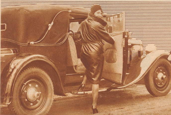
Mit Lindt ist man immer in guter Gesellschaft

Als der Riese Palü kam, und nach Böögg fragte, machte sie nur: «Pist, pist, s'Baby schloft.» Dann drückte sie einem großen Faß Most den Boden ein, und reichte es dem Besucher zum Willkommen. Der trank es schnell aus, und ging wieder. Das Riesenbaby war ihm so in die Knochen gefahren, daß er gar nicht abwartete bis der Vater heimkam. Beschämt zog er sich über die Berge zurück und fristete hinfort, als kleiner Riese, ein trauriges Dasein. — Den Riesen Böögg aber führt man noch heute durch die Straßen von Zürich.