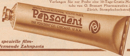
Die spezielle film-entfernende Zahnpasta

Verlangen Sie zur Probe eine 10-Tage-Gratis-Mustertube von O. Brassart Pharmaceutica A.-G., Zürich, Stampfenbachstraße 75.