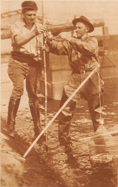
Zwei Fischer finden eine Wollhandkrabbe in einer Reuse, wo sie mehrere Fische aufgefressen hat