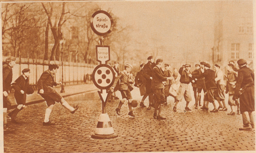
Die Spielstraße, — die Straße der Kinder. Kein Fahrzeug darf hier durchfahren

Niemals ist Ruhe auf den Straßen der Städte, immer ist da Lärm und Betrieb, vom frühen Morgen, wenn die ersten Autos und Motorräder knaltern, bis tief in die Nacht. Lustig ist es auf der Straße, das findet ihr gewiß alle, immer gibt es etwas zu sehen und zu lachen oder zu beobachten. Kein Mensch gleicht dem andern, jedes Auto, jeder Möbelwagen hat wieder etwas Besonderes, man kann herumgehen und sich die Welt und die Menschen ansehen wie ein Bilderbuch und wer die Augen gut aufmacht, wird ganze Geschichten daraus lesen. Aber gefährlich ist die Straße! Mit ihren vielen Fahrzeugen, der Hast