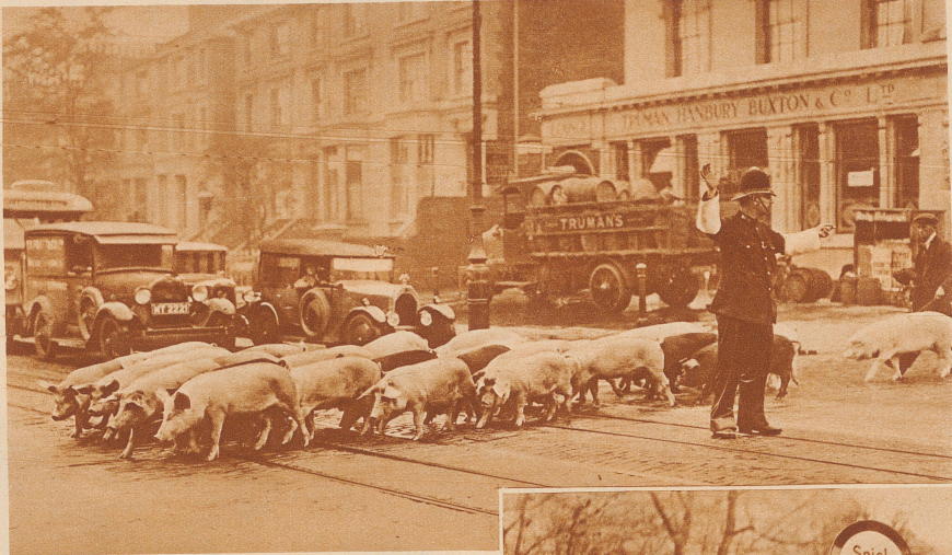
Der Verkehr wird gestoppt, — damit eine Ferkelherde sicher über die Straße kann

vollmelken. Da gibt es ein lustiges Durcheinander von Ziegen, deren Glocken läuten und Trams, deren Glocken auch läuten, und wenn zwei solche läutende Wesen aufeinanderstoßen, dann muß sicher das Tram nachgeben und warten, bis es der Ziege gefällig ist, auf das Trottoir zu hüpfen. — Für die Kinder aber, die in den großen Städten ja oft auf der Straße zu Hause sind, haben die städtischen Beamten viele Schutzmaßnahmen ausgedacht; viele Straßen gehören den Kindern ganz, das sind die Spielstraßen, auf denen keine Fahrzeuge fahren dürfen. An anderen aber leuchtet schon von weitem ein Schild: «Achtung, SCHULE, während den Pausen keine Durchfahrt.» Die schwierigen Verkehrsregeln und die Bedeutung aller Verkehrszeichen werden schon in der Schule gelehrt und oft gehen ganze Klassen mit ihrem Lehrer zusammen auf die Straßen, mitten in den dicksten Verkehr, um zu probie-