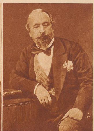
Exkaiser Napoleon III. im Exil zu Chislehurst in England im Jahre 1873 kurz vor seinem Tode