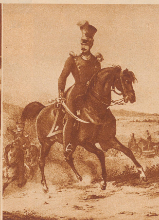
Prinz Louis Napoleon als Artillerie-Hauptmann im Jahre 1834