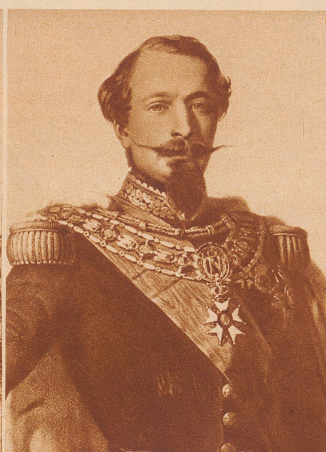
Napoleon III. Kaiser der Franzosen 1865