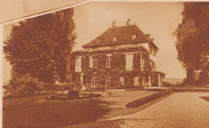
Schloß Arenenberg am Untersee, das Prinz Louis Napoleon und seiner Mutter, der Exkönigin Hortense, in den Jahren 1823–1837 als Aufenthaltsort diente. 1873–1892 wohnte da zeitweilig die Exkaiserin Eugenie. Sie schenkte das Besitztum im Jahre 1906 dem Kanton Thurgau. Heute beherbergt das Schloß das Napoleon-Museum. Die Oekonomiegebäude sind umgebaut zu einer landwirtschaftlichen Schule

Nachdem die Gemeinde Salenstein dem Prinzen Louis Napoleon das Ehrenbürgerrecht geschenkt hatte, beschloß der thurgauische Große Rat seinerseits, ihm auch das Kantonsbürgerrecht zu verleihen. In diesem Sinne wurde ihm am 30. April 1832 diese eigens für ihn angefertigte Urkunde ausgehändigt. Sie befindet sich jetzt im Museum Arenenberg