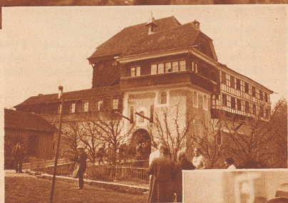
Die Wasserburg Hagenwil, von den Edlen von Hagenwil um 1300 dem Stift St. Gallen vermacht, diente den Aebten als Sommersitz. Seit 1806 ist die Burg im Besitze der Familie Angehrn