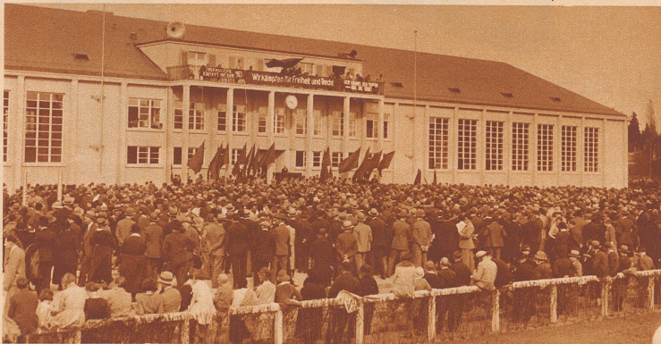
ZÜRICH: Die Versammlung der Parteimitglieder vor der Sihlhölzli-Turnhalle in Zürich