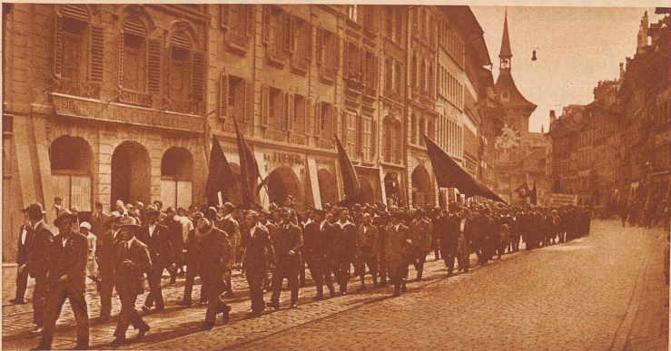
BERN: Der Berner-Umzug in der Marktgasse