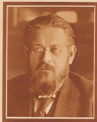
Albert Thomas Direktor des Internationalen Arbeitsamtes starb am 8. Mai in Paris, 54jährig. Nach einer großen politischen Karriere, die den Bäckersohn aus Champigny zum sozialistischen Deputierten des Seine-Departements und während des Krieges zum Munitionsmminister im Kabinett der Landesverteidigung machte, folgte er 1919 dem Ruf als Leiter des Internationalen Arbeitsamtes, dem er dreizehn Jahre mit seiner unerhörten Arbeitskraft und großen Organisationsfähigkeit vorstand. Die Schöpfung der internationalen Arbeitsorganisation ist allein sein Werk. Für das B. I. T. ist sein früherer Tod ein nicht leicht zu verwindender Schlag