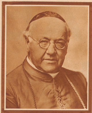
Dr. Georgius Schmid von Grüneck der Dekan der schweizerischen Bischöfe, starb 82jährig in Chur. 1875 zum Priester geweiht, kam er 1880 als Professor an das Priesterseminar Chur. 1889 wurde er Kanzler und 1908 Bischof der Diözese Chur