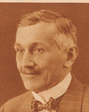
Kantonsoberrichter Friedrich Graf der seit 1919 den Posten eines Oberförsters des Kantons St. Gallen bekleidete und in Fachkreisen großes Ansehen genoss, ist im 47. Altersjahr in St. Gallen gestorben. Er war seit 6 Jahren Präsident des Schweizerischen Forstvereins