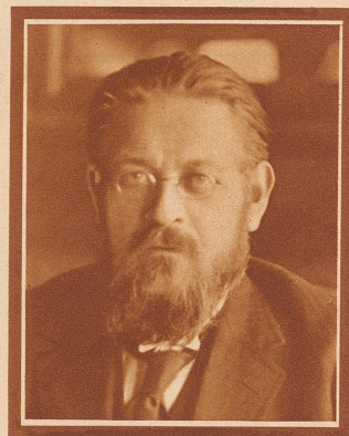
Albert Thomas Direktor des Internationalen Arbeitsamtes starb am 8. Mai in Paris, 54jährig. Nach einer großen politischen Karriere, die den Bäckersohn aus Champigny zum sozialistischen Deputierten des Seine-Departements und während des Krieges zum Munitionsminister im Kabinett der Landesverteidigung machte, folgte er 1919 dem Ruf als Leiter des Internationalen Arbeitsamtes, dem er dreizehn Jahre mit seiner unerhörten Arbeitskraft und großen Organisationsfähigkeit vorstand. Die Schöpfung der internationalen Arbeitsorganisation ist allein sein Werk. Für das B. I. T. ist sein früherer Tod ein nicht leicht zu verwindender Schlag