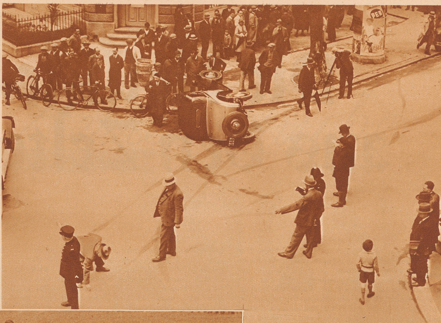
Schwerer Autounfall — 1 Todesopfer. An der Kreuzung Dufourstrasse-Feldeggstrasse in Zürich 8 ereignete sich infolge zu raschen Fahrens ein arger Zusammenstoß. Einer der beiden Wagen wurde in die Straße geworfen, der andere drehte sich um die eigene Achse, fuhr auf das Trottoir und verletzte eine Fußgängerin derart schwer, daß sie kurze Zeit nach dem Unfall starb. Unser Bild zeigt die Unfallstelle. Die Polizei nimmt den Tatbestand auf. Die Brems Spuren sind deutlich sichtbar