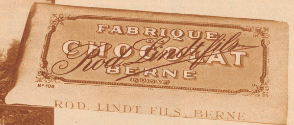
Köstlich, herrlich, fein - nur Lindt Chocolate