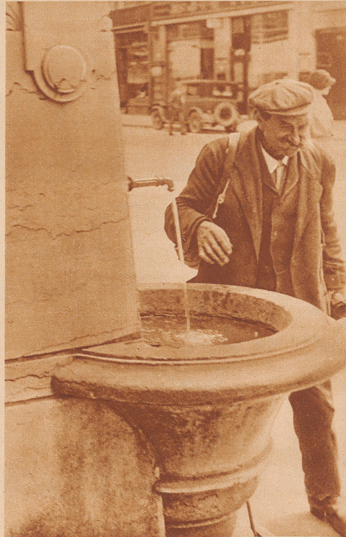
AUFNAHMEN BISCHOF UND ACKLIN