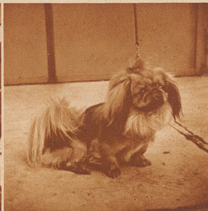
«Ching Foo of Oldbourne», der Champion der Pekinesen. Er erzielte bereits in England 18 erste Preise