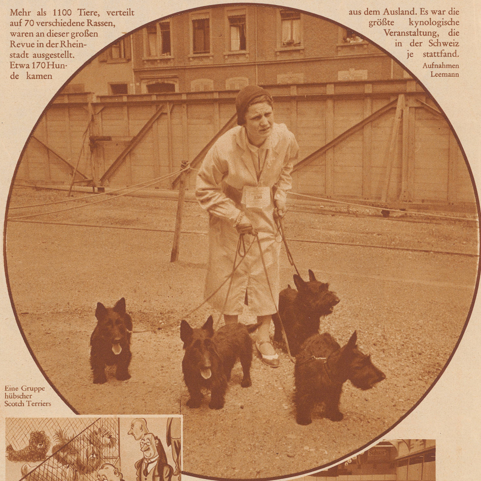
Eine Gruppe hübscher Scotch Terriers