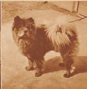
«Chang» erhielt den Siegertitel der Chow-Chow-Rasse. Er stammt aus der Linie des berühmten «Lemming», der für 50 000 Fr. verkauft wurde. Für den Bahntransport nach Basel war «Chang» für 25 000 Fr. versichert