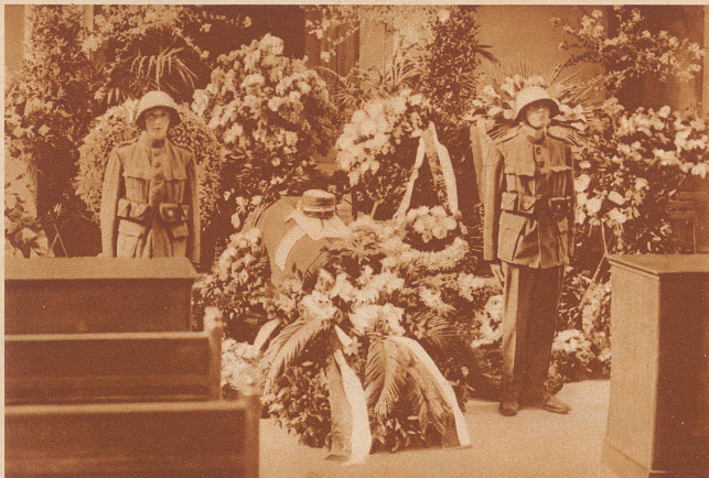
Der aufgebahrte Sarg in der Fraumünsterkirche während der Trauerfeier. Mütze, Schärpe und Säbel des Verstorbenen liegen auf dem Sarge. Zwei Fusiliere halten die Ehrenwache