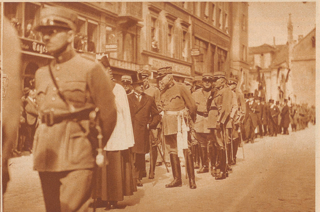
Bundesrat Minger (im Zylinder) und rechts von ihm Oberstkorpskommandant Wildbolz im Trauerzug