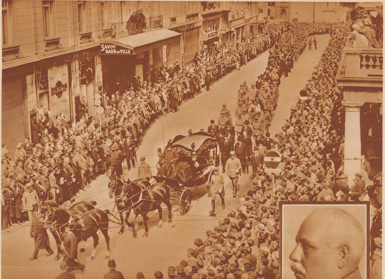
Der Trauerzug in der Poststraße. Vom Fraumünster bis zum Krematorium bildet zu Tausenden die Bevölkerung Spalter. Vier hohe Truppenführer schreiten neben dem Leichenwagen. Dem Sarge folgen die Angehörigen, der Korpsstab 2, Bundesrat Minger, der Chef des Militärdepartements, die Kommandanten der Heeresseinheiten, die Waffen- und Abteilungschefs, die Militärattachés von Frankreich und Italien. Der Vorbeimarsch des Zuges dauerte 20 Minuten