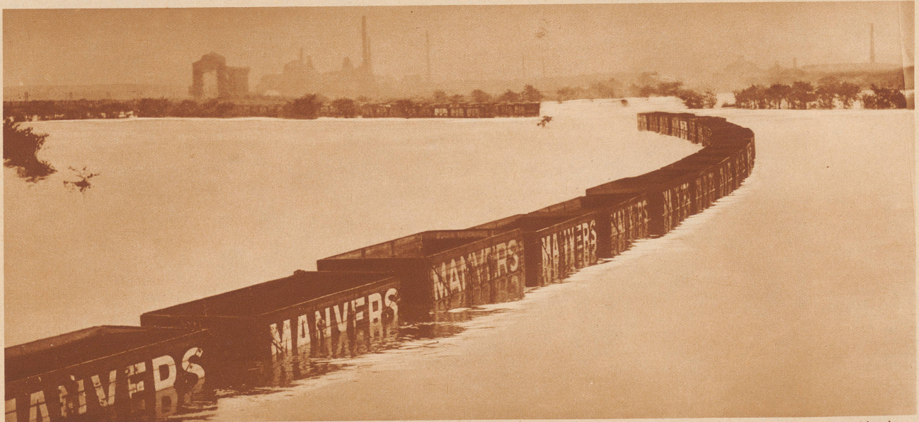
Hochwasser in Mittelengland. Durch heftige und dauernde Regenfälle der letzten Tage sind die Grafschaften Nottingham, Lincolnshire und Yorkshire von riesigen Ueberschwemmungen heimgesucht worden. Weite Gebiete dieser Grafschaften stehen unter Wasser. Am größten ist das Unheil in der Grafschaft Derby. Dort beträgt der bis jetzt entstandene Schaden mehr als 400 000 Pfund Sterling. Hunderte von Häusern mußten geräumt werden. Man glaubt, daß Wodien vergehen werden, bis die Situation wieder normal ist. Unser Bild zeigt einen Leeren Kohlenzug, der im mannshoch überfluteten Gebiet in der Nähe von Yorkshire stehengeblieben ist