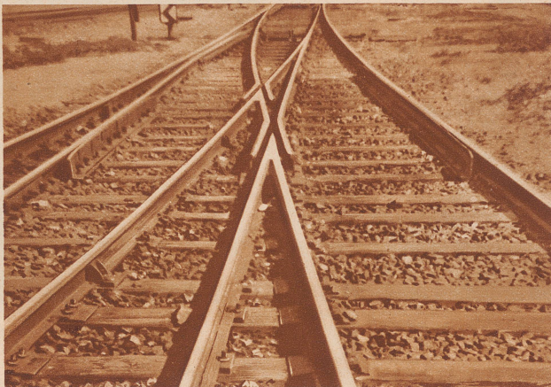
Preisgerätee Aufnahme aus dem Kodak-100000 Dollar-Welt-Wettbewerb

G.H. Zenith-Stumpfen sind unübertroffen, mild und würzig Preis Fr. 1.— GAUTSCHI, HAURI & Co