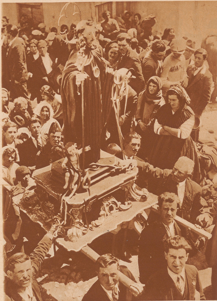
Die Schlangenprozession in Cocullo.

In dem kleinen Dorfe Cocullo in den Abruzzen findet jedes Jahr anfangs Mai eine merkwürdige Prozession statt. Dem heiligen Dominikus schreiben die Coculloaner eine wundertätige Kraft gegen giftige Schlangen zu. Darum wird am Tage dieses Heiligen seine Statue, behängt mit lebenden ungiftigen Schlangen, durch die Straßen getragen. Die Schlangen werden am Tage vorher in den Wäldern gefangen und zur Feier des Tages wickeln die Kinder sich ohne jede Angst die Tiere um den Hals. Durch diese Prozession wollen die Bewohner der schlangenreichen Gegend sich für das kommende Jahr gegen die giftigen Reptilien schützen.