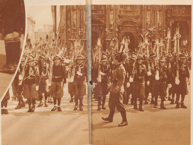
Faschistische Avanguardisten mit ihrem Skigriff auf dem Mailänder Domplatz