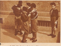
Ballila-Markierer bei einer Dienstreise