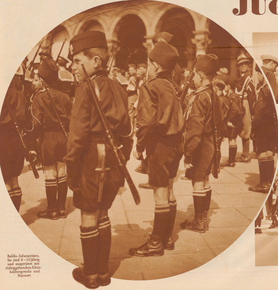
Ballila-Infanteristen. Sie sind 8-10-jährige und angelehnt mit rüchengebundenen Kleinkalibrgewehr und Bajonet.