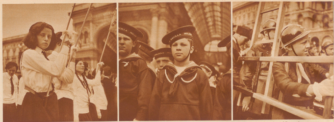
Führergruppen der faschistischen Jugendkader-Organisation