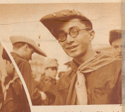
Faschistische Studenten. Die typische italienische Studentenmütze ist bei ihnen behütet worden