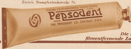
Die spezielle filmentfernende Zahnpasta

Verlangen Sie zur Probe eine 10-Tage-Gratis-Muster-tube von O. Brassart Pharmaceutica A.-G., Zürich, Stampfenbachstraße 75.