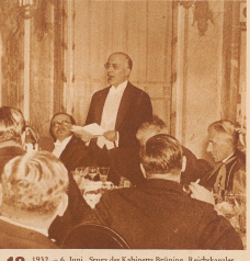
18 1932. - 6. Juni. Sturz des Kabinetts Brüning. Reichskanzler Brüning bei seiner letzten öffentlichen Rede