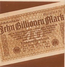
14 1923. - 15. November. Am Tage der Stabilisierung der Mark wurde ein Zehn-Billionen-Mark gegen zehn Rentenmark eingetauscht