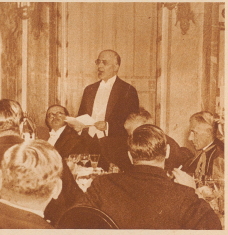
18 1932. - 6. Juni. Sturz des Kabinetts Brüning. Reichkanzler Brüning bei seiner letzten öffentlichen Rede