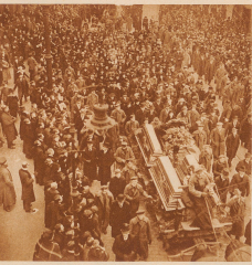
5 1918. - 28. Januar. Vorbereitung Karl Liebknechts. Er wurde zusammen mit Rosa Luxemburg, deren Leiche erst später im Landeshotel gefunden wurde, am 18. Januar von Offizieren der kaiserlichen Armee ermordet. Der Tod der beiden Führer befeuerte die Schichten der kommunistischen Spartakusbewegung