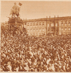
8 1919. - 23. Juni. Ungehöriger Massenaufruf im Berliner Lustgarten gegen den Versailler Friedensvertrag. Schandenspruch gegen den geplanten «Gewaltfrieden»