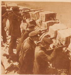
2 1918. - 2. November. In ganz Deutschland bricht die Revolution aus. Bewaffnete Volkstruppen in Berlin, in Kampfstellung hinter schnell errichteten Zeitungsbarricaden