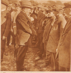
7 1919. - 21. August. Friedrich Ebert wird zum ersten Präsidenten der Republik gewählt