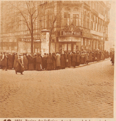
13 1921. Beginn der Inflation. Ansehen nach Lebensmittel in den Straßen von Berlin