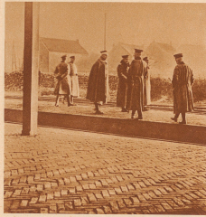
1 1918. - 8. November. Der deutsche Kaiser überschreitet die holländische Grenze

Das Deutsche Reich steuert in diesen Tagen und Wochen in ein neues unbekanntes Schicksal hinein. Wird es die Weimarer Verfassung behalten und schützen, werden die Kräfte der Demokratie sich gegen die mächtigen Gegenströmungen durchsetzen? Niemand weiß es. Unwillkürlich wenden sich die Blicke zurück, — auf die Geschichte der Geburt und der ersten Lebensjahre der deutschen Republik.