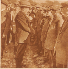
7 1919. - 21. August. Friedrich Ebert wird zum ersten Präsidenten der Republik gewählt