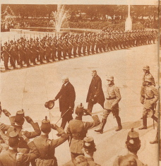
15 1925. - 28. April. Nach dem Tode Eberts wird Feldmarschall von Hindenburg mit 14,6 Millionen Stimmen zum Präsidenten der Republik gewählt und leitet den Fall auf die Verfassung. 13,7 Millionen Stimmen waren auf den Zentrumsführer Dr. Brüning entfallen