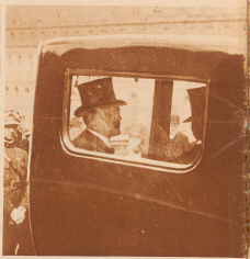
9 1919. - 28. Juni. Die deutschen Minister Hermann Müller und Hans Bötticher saßen zu Verhandlungen mit dem Friedensvertrag zu unterschreiben. Der deutsche Außenminister Graf Brockdorff-Rosenthals hatte sich geweigert, seinen Namen unter das verhängnisvolle Dokument zu setzen