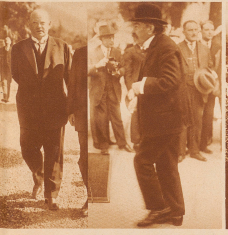
16 1925. - 5. Oktober. Der Vertrag von Locarno, gefordert durch Briand und Stresemann, anerkennt die Unverletzlichkeit der deutsch-französischen und deutsch-belgischen Grenzen von 1919 und verpflichtet die Vertragspartner, ebenfalls einem Schiedsgericht zu verfallen. Der Rückzug der Franzosen aus dem Rheinland wurde durch ihn vorbereitet