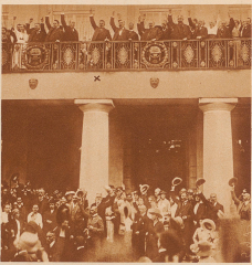
6 1919. - 11. August. Die konstituierende Nationalversammlung tagt in Weimar: die von Hugo Preuss ausgehende Verfassung, die bis in unsere Tage die Gestaltungsgrundlage der deutschen Republik bildet. (Der Volksbewegungs-Friede-Ebert?)