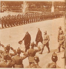
15 1925. - 28. April. Nach dem Tode Ebers wird Feldmarschall von Hindenburg mit 14,6 Millionen Stimmen zum Präsidenten der Republik gewählt und leistet den Eid auf die Verfassung. 13,7 Millionen Stimmen waren auf den Zentrumsführer Dr. Meißner entfallen