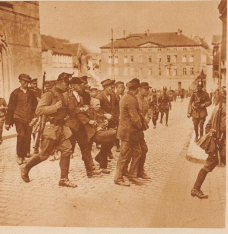
11 1921/22. Blühender Wirtschaft in Mitteldeutschland und Hamburg. Ein Bild aus dem Massenfest Aufmarsch. Abtransport gefangener Kooperations mit ihrem verurteilten Führer