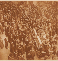
5 1918. - 28. Januar. Beseitigung Karl Liebknechts. Er wurde zusammen mit Rosa Luxemburg, deren Leiche erst später im Landeshotel gefunden wurde, am 18. Januar von Offizieren der kaiserlichen Armee ermordet. Der Tod der beiden Führer befeuerte die Schichten der kommunistischen Spartakusbewegung