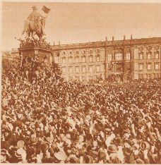
8 1919. - 23. Juni. Ungeheurer Massenaufruf im Reichler Lager gegen den Versailler Friedensvertrag. Schandenspruch gegen den geplanten 'Gewaltfrieden'