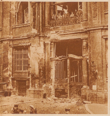
4 1918. - 24. Dezember. Heftig in der Kampf zwischen sozialistischem und linksrevolutionärem Volkstruppen. Am Weihnachtsabend wird das Berliner Schloß besetzt, erobert und von Arbeiter- und Soldatenräten besetzt