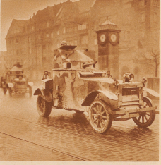
12 1921. März. Demonstration der Arbeiter durch die Franzosen. Französischer Panzer-Aus in den Straßen von Düsseldorf