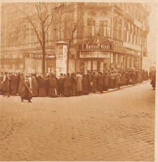
13 1921. Beginn der Inflation. Ansehen nach Lebensmittel in den Straßen von Berlin