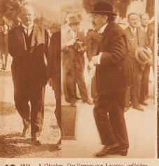
16 1925. - 5. Oktober. Der Vertrag von Locarno, gefordert durch Briand und Stresemann, anerkennt die Unverletzlichkeit der deutsch-französischen und deutsch-belgischen Grenzen von 1919 und verpflichtet die Vertragspartner, ebenfalls einem Schiedsgericht zu verfallen. Der Rückzug der Franzosen aus dem Rheinland wurde durch ihn vorbereitet