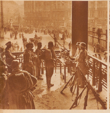
10 1920. - 13./17. März. Kapp-Putsch in Berlin, ein Versuch rechtsgerichteter Kreise, mit Waffenhilfe die die Ordnung wiederherzustellen. Berlin wurde von den Truppen von Kapp und Ehrhardt besetzt, innerhalb dreier Tage fand der Kapp-Putsch durch sofortigen Generalstreik sein Ende