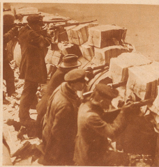
2 1918. - 2. November. In ganz Deutschland bricht die Revolution aus. Bewaffnete Volkstruppen in Berlin, im Kampfstellung hinter schnell errichteten Zeitungsbarricaden