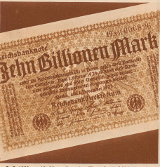
14 1923. - 15. November. Am Tage der Stabilisierung der Mark wurde ein Zehn-Billionen-Schein gegen zehn Rentenmark eingetauscht