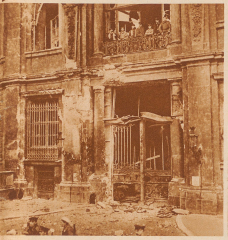
4 1918. - 24. Dezember. Heftig in der Kampf zwischen sozialist.-demokratischen und linksrevolutionären Volkstruppen. Am Weihnachtsabend wird das Berliner Schloß besetzt, erobert und von Arbeiter- und Soldatenräten besetzt