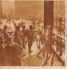
10 1920. - 13./17. März. Kapp-Putsch in Berlin, ein Versuch rechtsgerichteter Kreise, mit Waffenhilfe die die Ordnung wiederherzustellen. Berlin wurde von den Truppen von Kapp und Ehrhardt besetzt, innerhalb dreier Tage fand der Kapp-Putsch durch sofortigen Generalstreik sein Ende