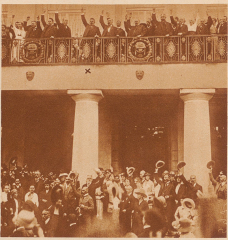
6 1919. - 11. August. Die konstituierende Nationalversammlung tagt in Weimar: die von Hugo Preuß vorgeschlagene Verfassung, die bis in unsere Tage die Gestaltungsgrundlage der deutschen Republik bildet. (Der Volksbewegungs-Führer Ebert *)