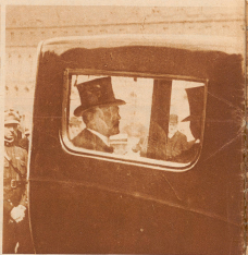
9 1919. - 21. Juni. Die deutschen Minister Hermann Müller und Hans Bötticher saßen im Versailler Friedensvertrag zu unterschreiben. Der deutsche Außenminister Graf Brockdorff-Rossum hatte sich geweigert, seinen Namen unter das verhängnisvolle Dokument zu setzen