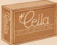
Carton à 10 Stück Fr. 1.80

SCHWEIZER VERBANDSTOFF- UND WATTEFABRIKEN A.G. FLAWIL