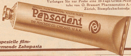
Die spezielle film-entfernende Zahnpaste

Verlangen Sie zur Probe eine 10-Tage-Gratis-Muster-tube von O. Brassart Pharmaceutica A. G., Zürich, Stampfenbachstraße 75.