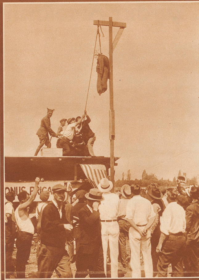
«So soll es jedem von uns gehen, der unverrichteter Dinge nach Hause zurückkehrt!» Unter diesem Motto hingen die in Washington kampierenden Veteranen eine Strohuppe am Galgen auf. Es ist anders gekommen, als sie dachten: der Senat hat ihre Forderungen nicht bewilligt. Sie sind entschlossen, weiterzukämpfen