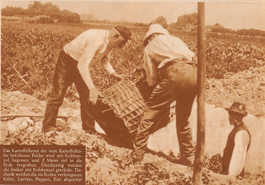
Das Kartoffelkraut der vom Kartoffelkäfer befallenen Felder wird mit Rohbenzol begossen und 2 Meter tief in die Erde vergraben. Gleichzeitig werden die Aecker mit Rohbenzol getränkt. Dadurch werden die im Boden verborgenen Käfer, Larven, Puppen, Eier abgetötet