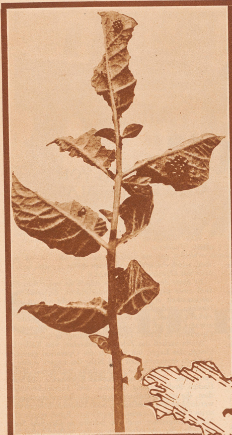
Kartoffelblätter, die vom Kartoffelkäfer stark angegriffen worden sind. Auf der Unterseite der Blätter pflegt der Käfer in Häufchen von 10 bis 30 Stück seine Eier abzulegen

Rechts: Die Zickzacklinie auf dieser Karte umschließt das vom Kartoffelkäfer bis jetzt in Frankreich verseuchte Gebiet. Es sind 32 Departemente. Der 200 Kilometergürtel ringsherum gilt als direkt gefährdete Zone. Sie reicht bis nahe an die Schweizergrenze bei Genf heran. Bereits ein Jahr nach der Entdeckung waren in Frankreich 28 Departemente heimgesucht. Der Käfer dringt jetzt mit einer jährlichen Geschwindigkeit von 35 km nach Osten vor. Fliegen kann er nicht besonders gut, kriechend kommt er täglich nur 2-3 m vorwärts. Doch bei seiner Wanderung kommt ihm der Wind zu Hilfe. Man hat festgestellt, daß einzelne Schwärme vom Sturm bis 40 km weit getrieben worden sind. Zum Schutze gegen die Einschleppungsgefahr hat Deutschland nicht nur aus dem verseuchten Gebiet, sondern auch aus der vorläufig gefährdeten Zone jede Einfuhr von Gemüse gesperrt