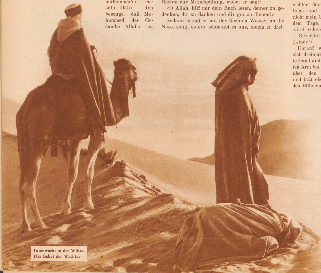
Totenwacht in der Wüste. Das Gebet der Wächter