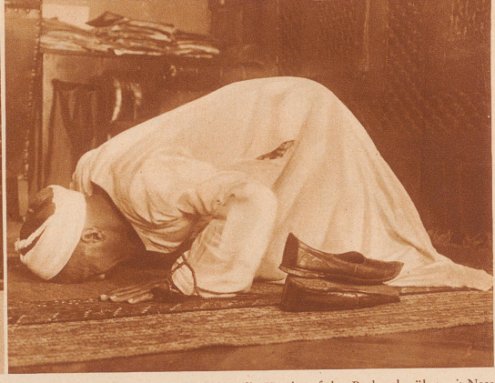
Der Betende sinkt auf die Knie, legt die Hände auf den Boden, berührt mit Nase, dann mit Stirn den Boden, dabei dreimal aufschlagend: «Die Vollkommenheit meines Herrn, des Allerhöchsten!» Sodann sinkt er auf die Fersen und ruft: «Allahu akbar!» Der Oberkörper wird jetzt emporgerichtet, wieder schnell auf die Fersen gesenkt, die Hände auf die Schenkel gelegt und «Allahu akbar!» gerufen. Abermals wird der Boden mit dem Gesicht berührt und aufgesagt: «Wahrlich wir haben dir Ueberfluß gegeben; / Darum bete zu deinem Herrn und schlachte Opfer! / Siehe, dein Hasser soll kinderlos sein!»