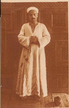
Die linke Hand unter der rechten, den Blick auf die Stelle gerichtet, die der Kopf bei der folgenden Niederwerfung berühren wird, sagt der Betende die erste, wie das Vaterunser siebenfach gegliederte Koransure auf: «Im Namen Allahs des Erbarmers, des Barmherzigen! / Lob sei Allah dem Weltenherrscher, Dem Erbarmen, dem Barmherzigen, / Dem Herrscher am Tage des Gerichtes! / Dir dienen wir, zu dir rufen um Hilfe wir; Leite uns den rechten Pfad, / Dem Pfad derer, denen du gnädig bist, / Nicht derer, denen du zürnst und nicht der Irrenden.»