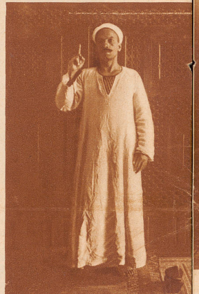
Den Zeigefinger der Rechten emporhebend, schwört der Betende: «Ich bezeuge, daß es keinen Gott gibt, denn Allah, und ich bezeuge, daß Mohammed sein Diener und Gesandter ist.»