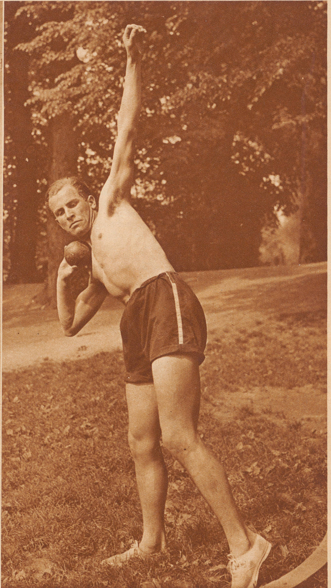
Aarauer Kantonsschüler 1932