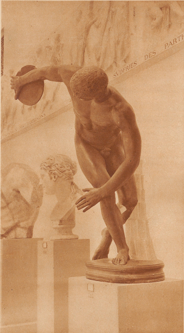
Myrons Diskuswerfer aus dem Jahre 450 v. Chr.