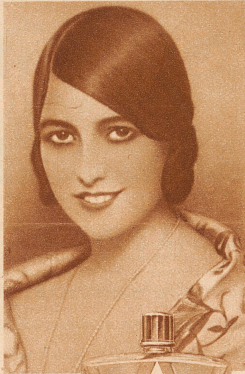
Große Flasche (1/2) Fr. 5.— Kleine Flasche (1/4) Fr. 3.50

Für systematische Haar-pflege benötigen Sie nach dem Haarwaschen ein Haarwasser, das die Schuppen beseitigt, die Kopfhaut stärkt und die Erneuerung der Haare ermöglicht. Im Zusammenhange mit GEOVI-SHAMPOO und auf der nämlichen sorgfältigen Grundlage wurde das GEOVI-ANTISEBOROL gearbeitet. Zu fettes Haar wird wieder voll und seidenglänzend. Qualität für fettes und für trockenes Haar.