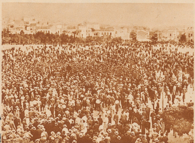
Riesendemonstration in Athen.

Das starke Wachsen der nationalsozialistischen Bewegung hat umgekehrt die Bildung einer «Antifaschistischen Einheitsfront» auf den Plan gerufen, in der sämtliche linksgerichtete Parteien (Sozialdemokraten, Reichsbanner, Mitglieder der Sozialistischen Arbeiterpartei, Kommunisten) gemeinsam in den Wahlkampf marschieren. Eine Kundgebung dieser Einheitsfront, die in den letzten Tagen in Berlin stattfand, ist wohl die größte Massenversammlung, die Berlin je erlebt hat. – Unser Bild zeigt einen kleinen Ausschnitt aus der ungeheuren Menschenmenge: in den Gesichtern spiegelt sich die starke politische Erregung, die sich in Deutschland allen Menschen mitgeteilt hat