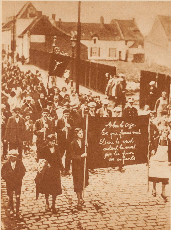
Streikbewegungen und Unruhen im belgischen Kohlengebiet.

Im Borinage, in den belgischen Kohlenbergwerken von Mons und Charleroi, sind die Bergarbeiter in den Streik getreten, der sich schnell auch auf die Schwerindustrie ausbreitet. Auch die Arbeiterfrauen beteiligen sich hier mit besonderer Heftigkeit an der Bewegung und marschieren an einzelnen Orten sogar als Anführerinnen an der Spitze der Demonstrationen unter der Parole: «Der Wille der Frau – ist der Wille Gottes! Lieber sterben als noch länger den Hunger der Kinder mitansehen»