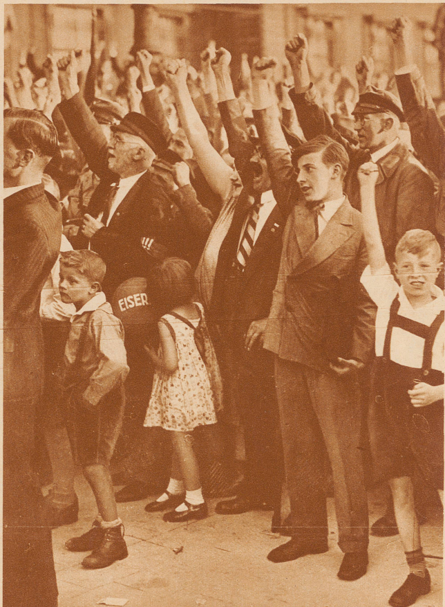
Deutschland vor den Wahlen: Konzentration der politischen Parteien.

Im Borinage, in den belgischen Kohlenbergwerken von Mons und Charleroi, sind die Bergarbeiter in den Streik getreten, der sich schnell auch auf die Schwerindustrie ausbreitet. Auch die Arbeiterfrauen beteiligen sich hier mit besonderer Heftigkeit an der Bewegung und marschieren an einzelnen Orten sogar als Anführerinnen an der Spitze der Demonstrationen unter der Parole: «Der Wille der Frau – ist der Wille Gottes! Lieber sterben als noch länger den Hunger der Kinder mitansehen»