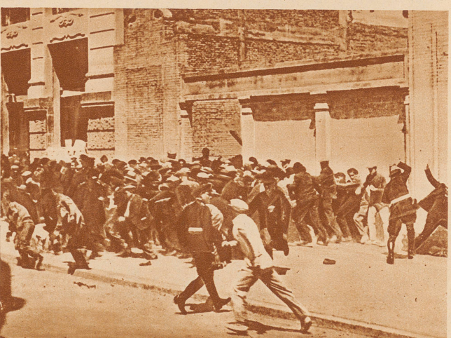
Unruhen-Kette in Spanien.

Die griechischen Wasser- und Elektrizitätsgesellschaften, die sich in englischen und amerikanischen Händen befinden, haben sich infolge des Sturzes der Drachme veranlaßt gesehen, ihre Preise um 50% zu erhöhen. Gegen diese Preispolitik fand in Athen eine große Demonstration statt, an der 40 000 Menschen teilnahmen, – ein in Griechenland noch nie erlebter Massenbesuch. Es wurde ein Verbraucherstreik beschlossen: die Läden sollen vor Anbruch der Dunkelheit geschlossen und zur Beleuchtung sollen nur Petroleumlampen benutzt werden; auch der Wasserverbrauch soll möglichst eingeschränkt werden