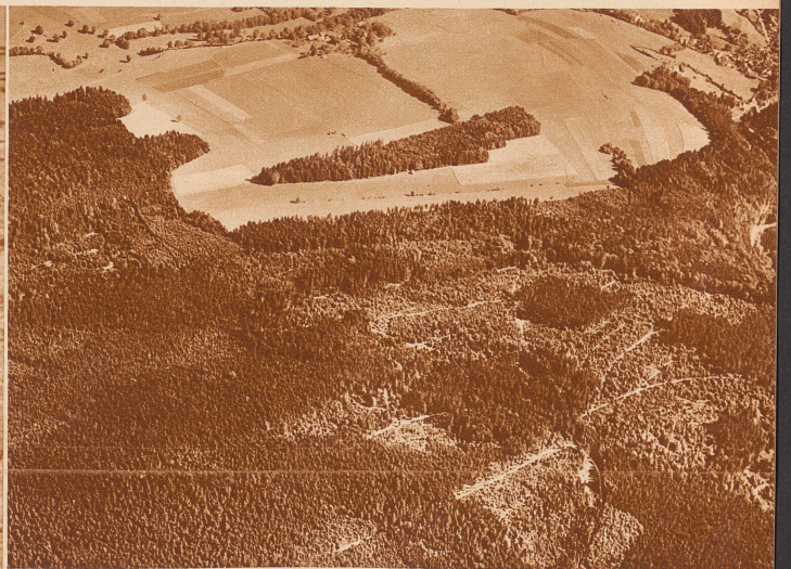
Die Ausländer stellen sich unter dem Begriff «Schweiz» immer nur den Himmel starrende Bergriesen, Gletscher und Abgründe vor. Wie schön und anmutig ist aber auch unser Mittelland, die weiten Wälder, nur unterbrochen von Wiesen, Aeckern, Dörfern. Der Blick kann hier freier schweifen, der Horizont ist größer, die Landschaft beruhigt und sättigt