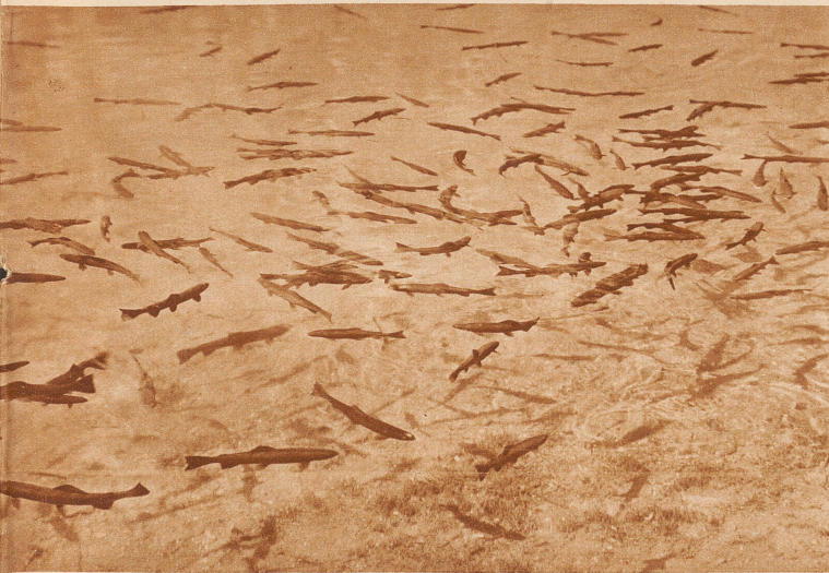
Forellen im Bergsee! So klar ist das Wasser, daß noch die zarten Schatten jedes einzelnen Fisches deutlich erkennbar mitanzusehen. Stundenlang still am Wasser zu sitzen, fischend oder als bloßer Augen-Liebhaber, — es gibt nicht vieles, das so ausruht und erfrischt Aufnahme Ryffel

grüßen? Wer ihnen einmal nachgeht und sich ihre Aussprache am Abend bei einem Glas Wein von den umgänglichen Bündner Dörfnern erklären läßt, der lernt eine wundervolle Sprache, temperamentvolle Eidgenossen und ein paar sehr gute Weine kennen. — Endlos könnte man weiter aufzählen, die Ferienwochen müßten sich zum Jahr dehnen, wollte man alles durchgenießen. Jeder kann sich aus einer Ueberfülle wählen, — ihr seht, es ist a l l e s zu haben: großartige, liebliche, mondäne, besinnliche, sportliche und gelehrte — herrliche Ferien!