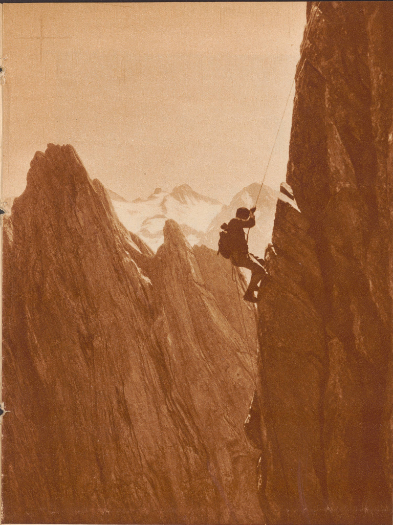
Für die Jungen, Gesunden, nach starken Reizen Durstigen, für jene, die sich nicht entspannen, sondern im Gegenteil den Willen anspannen wollen: Die Berge!