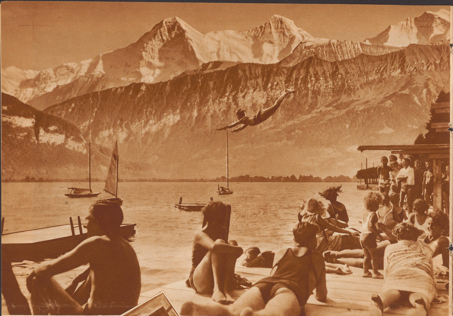
Sommerheiße Luft, ein kühler See, dahinter bewaldete Berge und Schneegipfel, — welche Häufung von schönen und erquickenden Dingen!