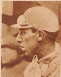
Büchi (Schweiz) placiert sich im Gesamtklassement mit 155:25,22 an 11. Stelle