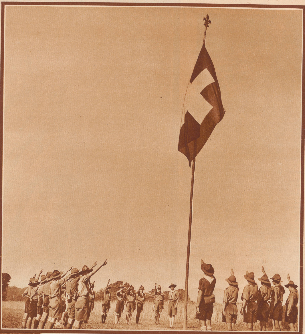
Durch Hiszen der Schweizerfahne wurde das 2. Nationallager am 28. Juli eröffnet