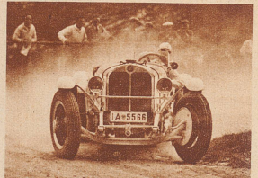
Der Rennfahrer Hans Stuck von Villiez, Berlin, verbessert auf seinem 7 Liter-Sechszylinder «Mercedes-Benz» in der Zeit von 17:00,6 den 1930 von Caracciola aufgestellten Sportwagenrekord um 4 Sekunden