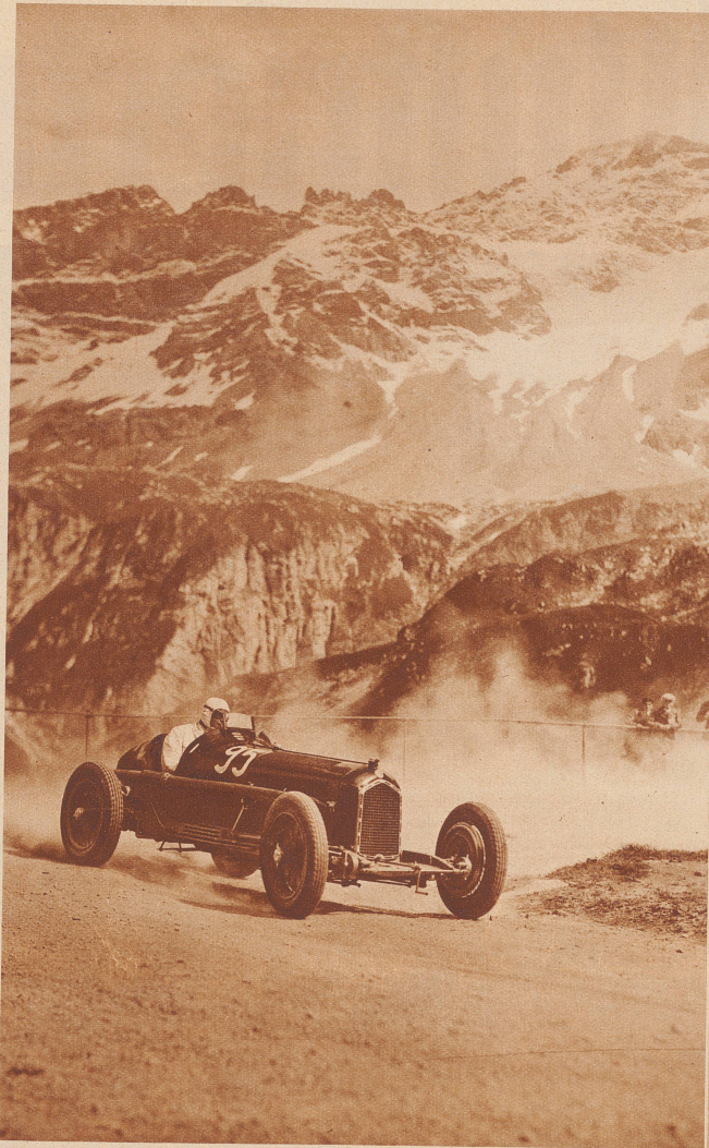
Caracciola in der Kurve. Der durch seine beispiellose Kaltblütigkeit sich auszeichnende Rennfahrer bringt die große Ueberraschung – er schlägt auf «Alfa Romeo» den bisherigen Klausenrekord von 16:24,6 und bezwingt die Strecke mit einem Durchschnittstempo von 82 km in 15 Minuten 50 Sekunden. Zu beachten ist, wie ganz anders Caracciola die Kurven nimmt. Schon in der Kurvenmitte hat er den Wagen vollständig in die neue Richtung umgedrückt