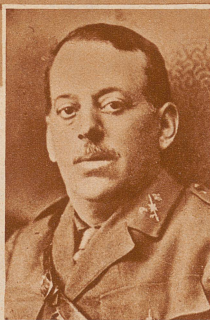
General Sanjurjo, der Führer der spanischen Aufstandsbewegung. Er wurde nach Mißlingen des Putsches verhaftet und wird vor ein Kriegsgericht gestellt werden. Der zweite Führer der Monarchisten in Sevilla, General Puerto, hat Selbstmord begangen

Links: Der Militär-Aufstand in Spanien. Ein monarchistischer Putsch gegen die republikanische Regierung Spaniens ist schnell niedergeschlagen worden: in Madrid nach wenigen Stunden, in Sevilla, wo der ehemalige Chef der Guardia Civil, General Sanjurjo, sich an die Spitze des Aufstandes stellte, nach einem Tag. — Bild: Regierungstreue Soldaten bei der Festnahme eines Putschisten