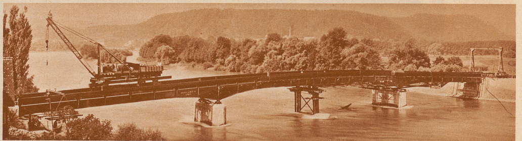
Neue Verbindung Schweiz—Deutschland. Die neue Brücke über den Rhein zwischen dem schweizerischen Koblenz und dem badischen Waldshut, die jetzt im Rohbau fertiggestellt ist und demnächst dem Verkehr übergeben wird