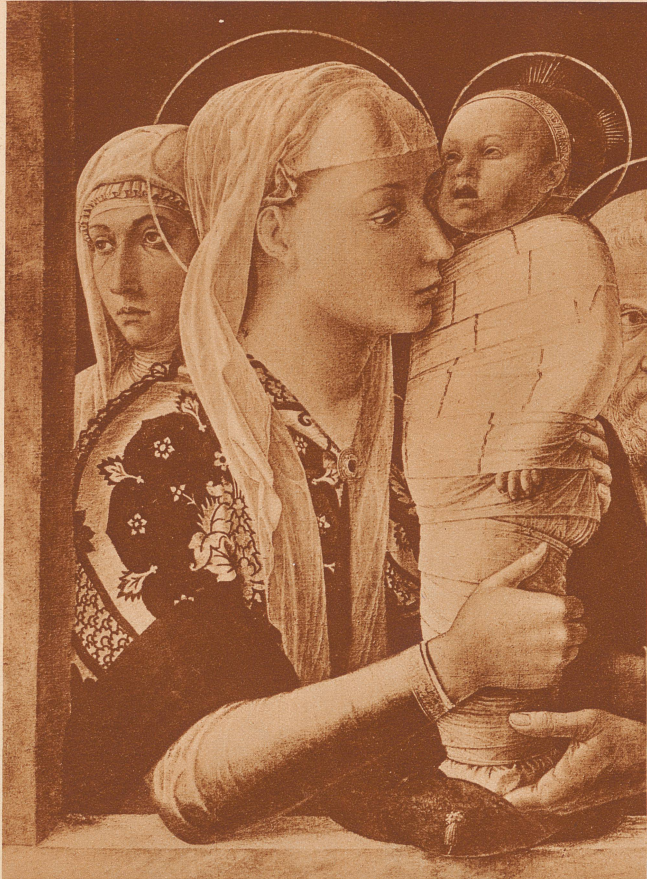
Dieses Christkind zeigt deutlich, wie man die ganz kleinen Kinder zur Zeit, da das Bild gemalt wurde, kleidete: eng umschmürt von schweren Windeln, nicht einmal die Aermchen durften sich bewegen