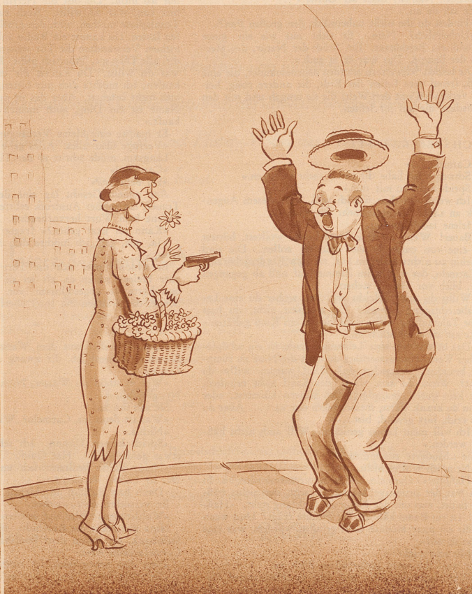
Wohltätigkeitsfest in Chicago.