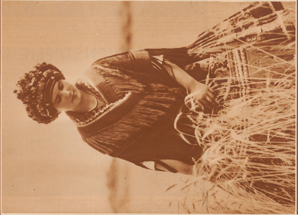
Ungarisches Bauernmädchen