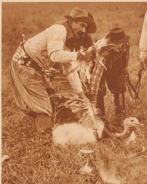
Die Gauchos sind von den Pferden gesprungen, haben den Nandu niedergedrückt, plündern gründlich seinen Balg und lassen ihn nachher wieder frei

Es ist reizvoll, die Nandujagd zu betreiben, aber schwer. Fast so schwer, wie sie zu photographieren.