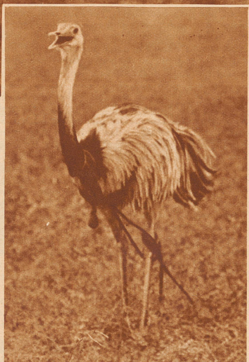
Der Nandu ist gefangen. An Hals und Beinen ist er mit der Boleadora gefesselt und wartet darauf, gerupft zu werden

Mit Windeseile jagt der Nandu über die Pampas, hinterher die verfolgenden Jäger. Ueber ihren Köpfen kreist das Lasso, das im nächsten Augenblick sich um die Beine des Vogels schlingen wird