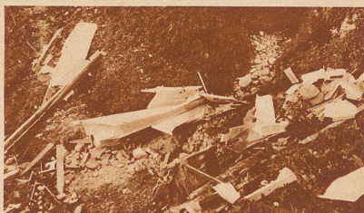
Die Ueberreste des abgestürzten Segelflugzeuges. Beim Bodenaufprall wurde die Maschine total zertrümmert. Der Pilot wurde 40 Meter weg vom Aufschlagsort mit Schädel-, Genick- und Beinbrüchen aufgefunden. Er muß augenblicklich getötet worden sein

Im schönsten Segelfluggebiet der Voralpen, an den Nordhängen der Rigi, waren in den Tagen vom 25. bis 28. August die schweizerischen Segelflieger versammelt. Das Meeting war von Anfang an vom Mißgeschick verfolgt — der junge Zürcher Segelflieger Reutemann stürzte tödlich ab — dennoch sind bei der Veranstaltung einige schöne Leistungen registriert worden.