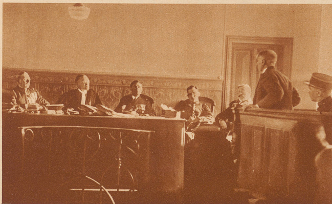
Henri Guilbeaux , der französische linksstehende Politiker, der 1918 wegen antimilitaristischer Propaganda, die er hauptsächlich von der Schweiz aus betrieb, in seiner Abwesenheit zum Tod verurteilt worden war, ist jetzt vor Verjährung des Urteils nach Frankreich zurückgekehrt und hat sich dem Gericht gestellt. Sein neuer Prozeß, der vor einem Pariser Militärgericht stattfindet, ist für Frankreich eine Sensation. — Guilbeaux (stehend), während der Verhandlung