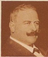
Alt Nationalrat J. Bürgi, Arth starb 88 Jahre alt. 1904 bis 1908 war er Mitglied des schwyzerischen Kantonsrates. 1919 bis 1928 vertrat er die Bauernpartei im Nationalrat. Um die Förderung der Braunviehzucht hat er sich große Verdienste erworben