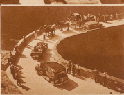
Zweiertei Herdkräfte begegnen sich.