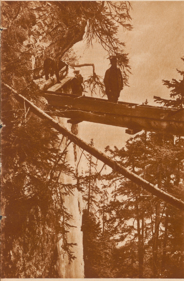
Hier ist noch ein Stück jensei oben Hochalpen zu sehen, die sich um abendliche Föhnwinde herum und seine Hänge entlang ziehen. Diese unter Lebensgefahr erprobten Leitungen zeigen für die zöbe Ausdauer, womit die Wälder Boer sich von der Natur das unerschütterliche Wasser erobern.