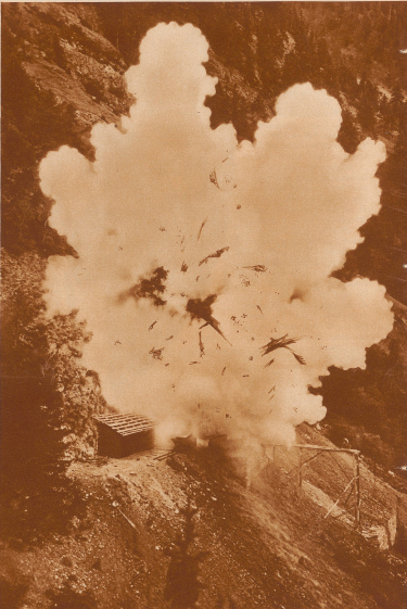
Die Sprengung einer Silbermine im Lötschental. Der Film «Die Herrgottsgrenadiere» in von starker Dramatik erfüllt, die es sogar, wie unser Bild beweist, an einem richtigen Kollisionsfeld nicht fehlt.