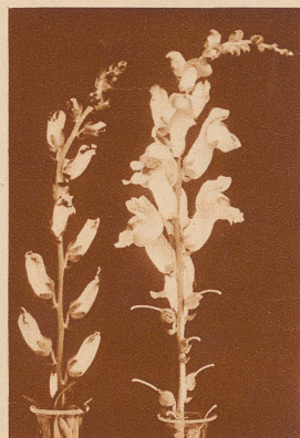
Rechts: normaler Blütenstand der Löwenmaulpflanze. Links: überentwickeltes Löwenmaul als Folge der Bestrahlung der Mutterpflanze durch Röntgenstrahlen