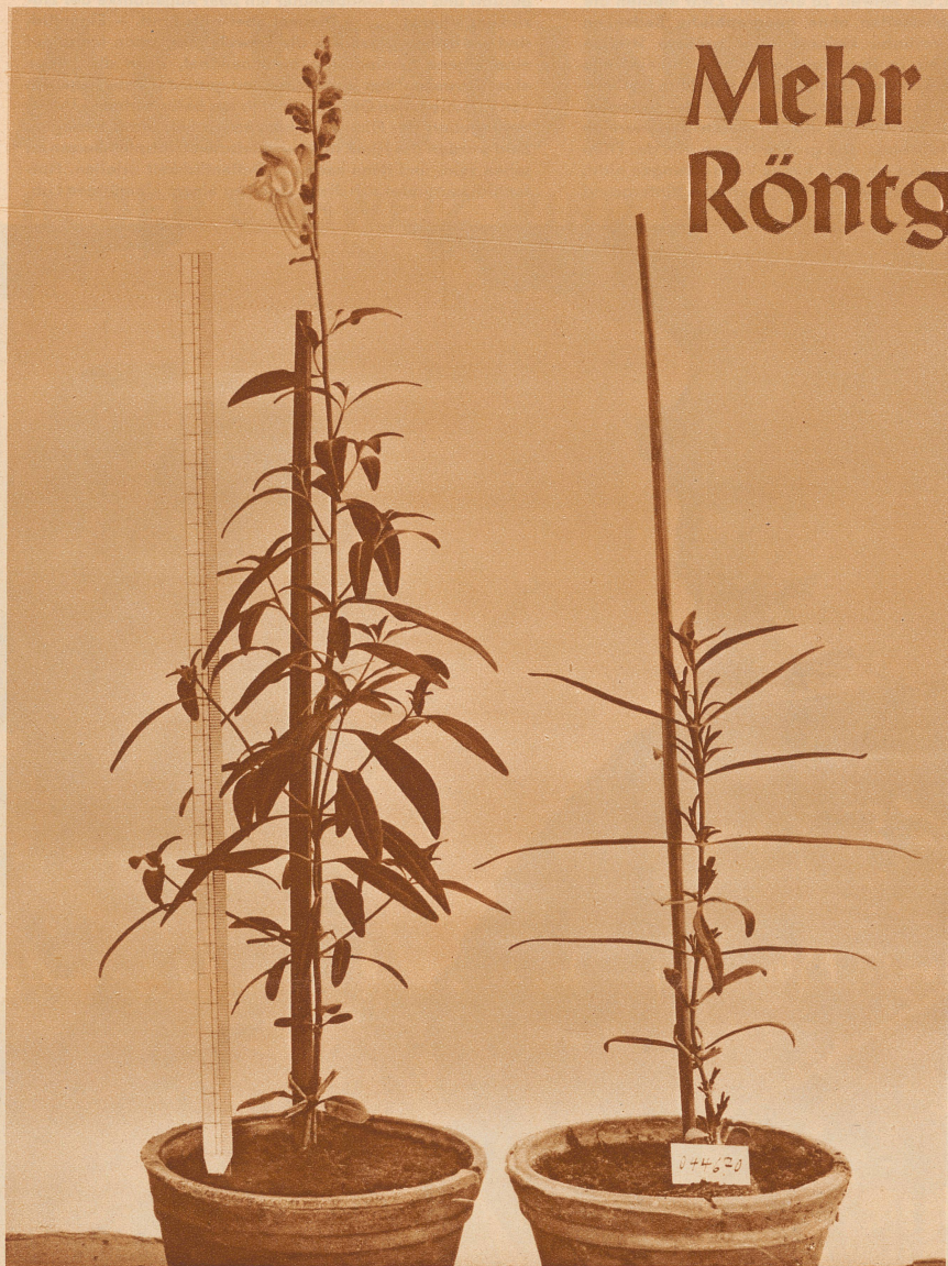
Ich seh in zierlicher Gestalt Ein artig Männlein sich gebärden. Faust II.

Die Geschichte der Technik könnte man einteilen in eine Periode, in der das Erreichte hinter den Visionen eines Jules Vernes oder Wells nachhinkte und in einem Zeitabschnitt der Ueberraschungen, in dem die Wirklichkeit den kühnsten Phantasien der Propheten vorausleucht. Der Trennungsstrich, der beide Zeitalter trennt, fällt ungefähr mit der letzten Jahrhundertwende zusammen.