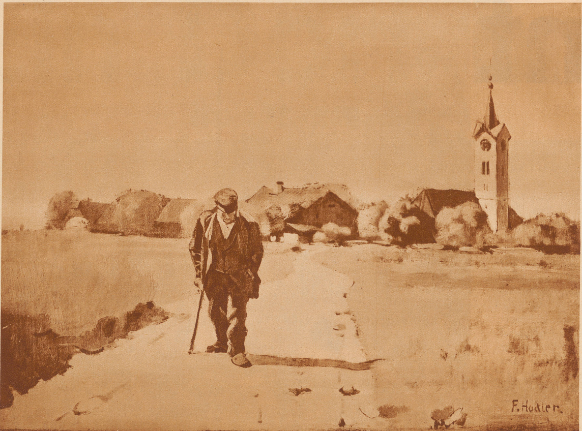
«Der frühe Hodler»

Das Kunstmuseum Winterthur zeigt bis Mitte Oktober rund 100 Werke aus dem Frühwerk Ferdinand Hodlers aus den Jahren 1871–1893. Die Museen von Basel, Bern, Zürich haben wertvollste Stücke beige-steuert, vor allem aber ist der schweiz. Privatbesitz hervorragend vertreten. Ein Großteil des Ausstellungsgutes ist der weitem Öffentlichkeit bis anhin völlig unbekannt oder kaum zugänglich gewesen. — Die allgemein bekannteren großen Figuralstücke der Frühzeit — etwa «Die Nacht», «Calvin», «Das Gebet im Kanton Bern» und ähnliche — fehlen allerdings, doch sind einige wichtigste Uebergangswerke zum großen Stil vertreten, so «Das mutige Weib», «Der ewige Jude», «Der Lebensmüde» von 1889. Im Uebrigen ist der Nachdruck sonst ganz auf den intimen frühen Hodler gelegt. So verschiebt sich die übliche, längst revisionsbedürftige Akzentsetzung höchst interessant. — Kostbarstes Gut in Landschaft und figürlicher Darstellung findet sich in dieser vorzüglichen Ausstellung. Man erkennt schon im «frühen» Schaffen überall die starken Keimkräfte zum «reifen» Hodler. Und über dem lebt ein jedes Werk sein ureigenstes köstliches Bild-Dasein als Dokument eines tiefen, schlichten Menschentums, wie auch als Offenbarung einer starken künstlerischen Persönlichkeit.