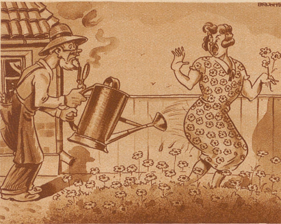
Der kurzsichtige Gärtner

Vor dem Leipziger Hauptbahnhof erlauchte ich folgendes Zwiegespräch: «Wemr hier geen Blads griechen, fahrnr nach Grimma». «Grimma — wie weid isn das?» «Nu wie weid werdsn sinn — zähn Gilomedr» «Echa, das ist doch ni zähn Gilomedr». «Nu, ich meene doch midn Audoh» «Ach so, da ganns schdim».