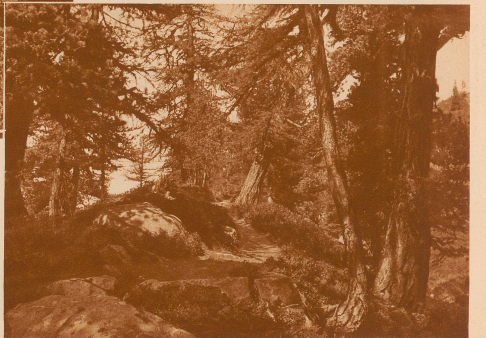
Arven und Lärchen am Wege durch den Aletschwald Johannes C. Loh