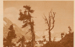
Verstörte Arvenspaziere aus der oberen «Kampzone», dem Gebiet östlich des gedünnten Waldes bis zur Baumgrenze, wo die Baumstämme allmählich ausklingen; und wo die Bäume um ihre Existenz kämpfen Johannes C. Loh