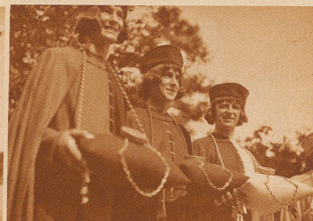
Die Siegelträger der drei Urkantone