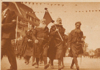
Die Abordnung der Schwyzer. Sie tragen keine künstlichen Bärte, sondern alles ist echt. Solch urchige Menschen gibt es noch im Lande Schwyz, gerade wie vor 600 Jahren

Der letzte Sonntag war für die Luzerner und die Ungezählten, die in Extrazügen aus allen Himmelsrichtungen in Luzern sich eingefunden hatten, ein frohfarbener und unvergeßlicher Festtag. Luzern feierte seine sechshundertjährige Zugehörigkeit zur Eidgenossenschaft. Das Fest nahm in allen Teilen einen ungewöhnlich prächtigen, an starken Eindrücken reichen Verlauf, und viele, die eigentlich nur die Sättigung ihrer Schaulust suchten, fühlten sich plötzlich gepackt von nachdenklicher Ergriffenheit. Es war ein wohlgeratenes und wahrhaft schönes Fest