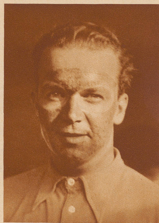
Der Sieger Rudolf Caracciola nach dem Rennen

Start im Finale. Nr. 6 ist Caracciola auf Alfa Romeo. Ganz vorn Nr. 24 ist Nuvolari, ebenfalls auf Alfa Romeo. Die Bugatti- und Maseratiwagen versuchten auch in Monza umsonst, den Siegeslauf der Alfa Romeowagen dieses Jahres aufzuhalten. Caracciola gewann das Rennen. 100000 Zuschauer! Herrliches Sommerwetter!