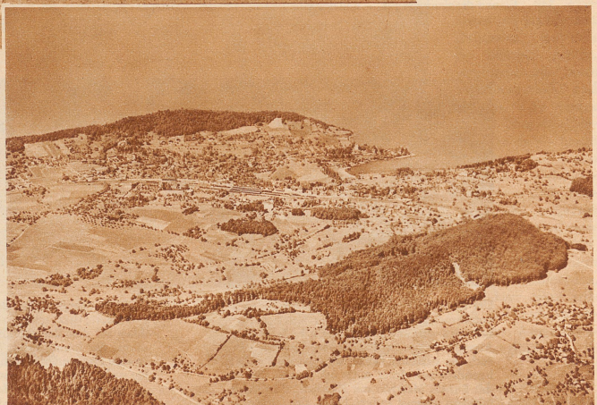
Zu Füßen des Niesen: Spiez und der Thunersee