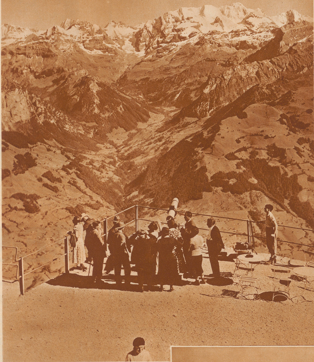
AUFNAHMEN VON W. SCHWEIZER