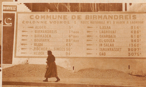
Wegweiser am Rande der Sahara. Er zeigt mit phantastischen Kilometerzahlen die kürzeste und einzige Route vom Mittelmeer durch die sonnenbesprühte Sahara in das Herz Afrikas an

Bei der halbversandeten Wasserstelle Hassi el Khrenig, 200 Kilometer von der Oase In Salah durch eine gefährdete und vollständig wasserlose Wüstenstrecke entfernt, begegnete ich zum erstenmal dem Wüstenpostreiter, der die Briefschaften der französischen Militärposten im Hoggar, in einem 750 Kilometer langen und ununterbrochenen Gewaltmarsch von zwölf Tagen nach der Postablage In Salah bringt. Mit schnellen, elastischen Schritten und sich frauenhaft in den Hüften wiegend, wanderte er mit seinem alabasterfarbenen Mehari (Reitdromedar) an unserer Karawane vorüber, so rasch, daß