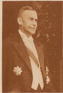
Minister Künzl-Jizerski, der neue Gesandte der Tschechoslowakei in Bern.