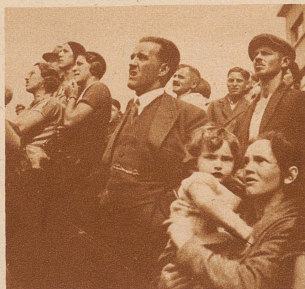
Die Zuschauer. Die Einwohner aller alten Schweizerstädte kennen sich aus in der Geschichte ihrer erngen Heimat. Die alten Bauten werden darum mit Liebe betrachtet und geachtet. Auch die Schaffhauser liebten ihren Schwabentorturm. Das Bedauern über den Brandfall ist daher allgemein und groß.

Am Vormittag des 22. September 1932 brach im Schwabentor, diesem wuchtigen Turm aus dem Mittelalter, Feuer aus. Eine im Dachstock wohnende Familie konnte im allerletzten Augenblick in Sicherheit gebracht werden. Der Turm brannte vollständig aus. — Der von den Flammen vernichtete Turmaufbau stammte aus dem 18. oder dem beginnenden 19. Jahrhundert. Das Schwabentor selbst jedoch stand schon im 14. Jahrhundert, im Jahre 1370 wird es zum erstenmal urkundlich genannt.