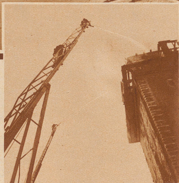
Die Feuerwehr an der Arbeit. Der Kampf gegen das Feuer konnte nur von außen her geführt werden, da das wie ein Kamin wirkende Turminnere in Flammen stand. Der sehr massive, steinerne Teil des Turmes blieb fast unbeschädigt, so daß mit einem Wiederaufbau des alten Bauwerkes gerechnet werden darf.

Am Vormittag des 22. September 1932 brach im Schwabentor, diesem wuchtigen Turm aus dem Mittelalter, Feuer aus. Eine im Dachstock wohnende Familie konnte im allerletzten Augenblick in Sicherheit gebracht werden. Der Turm brannte vollständig aus. — Der von den Flammen vernichtete Turmaufbau stammte aus dem 18. oder dem beginnenden 19. Jahrhundert. Das Schwabentor selbst jedoch stand schon im 14. Jahrhundert, im Jahre 1370 wird es zum erstenmal urkundlich genannt.