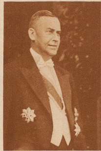
Minister Künzl-Jizerski, der neue Gesandte der Tschechoslowakei in Bern.