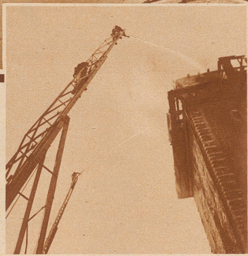
Die Feuerwehr an der Arbeit. Der Kampf gegen das Feuer konnte nur von außen her geführt werden, da das wie ein Kamin wirkende Turminnere in Flammen stand. Der sehr massive, steinerne Teil des Turmes blieb fast unbeschädigt, so daß mit einem Wiederaufbau des alten Bauwerkes gerechnet werden darf.

Am Vormittag des 22. September 1932 brach im Schwabentor, diesem wuchtigen Turm aus dem Mittelalter, Feuer aus. Eine im Dachstock wohnende Familie konnte im allerletzten Augenblick in Sicherheit gebracht werden. Der Turm brannte vollständig aus. — Der von den Flammen vernichtete Turmaufbau stammte aus dem 18. oder dem beginnenden 19. Jahrhundert. Das Schwabentor selbst jedoch stand schon im 14. Jahrhundert, im Jahre 1370 wird es zum erstenmal urkundlich genannt.