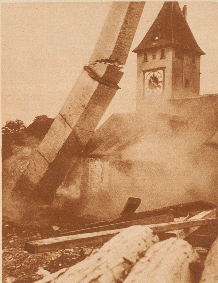
Ein Hochkamin wird umgelegt, — ein Storchenhorst verschwindet

Am 16. August dieses Jahres wurde das Sägewerk Neunkirch im schaffhausischen Klettgau ein Raub der Flammen. Von der ausgedehnten Anlage blieb nichts als ein starker Hochkamin von ganz respektablem Ausmaße stehen. Der Kamin war 25 Meter hoch, seine Mauern 45 cm dick, sein Inhalt 40 Kubikmeter. Aber auch dieses alte Wahrzeichen des Städtchens mußte weichen. Am 10. September ist es durch Sprengung niedergelegt worden. Seit 1920 war der Kamin ununterbrochen von einem Storchenpaar bewohnt. Einen von den acht Storchenhorsten, die es in der Schweiz noch gibt, beherbergte der Sägewerkkamin von Neunkirch. Zwei alte Störche verließen beim Brande das Nest erst als es bereits in Flammen war. Folgenden Tags reisten sie nach dem Süden ab. Es ist fraglich, ob die Störche nach diesem aufregenden Erlebnis nächsten Frühling wieder nach Neunkirch zurückkehren werden. Die Fälle sind nicht selten, daß Störche, selbst nachdem ihre Brutstätten durch Feuer zerstört wurden, wieder an ihren alten Niederlassungsort zurückkehren sind. Durch Errichtung einer neuen Nestanlage in der Nähe des ehemaligen Horstes wären vielleicht die Störche dem Städtchen Neunkirch zu erhalten. — Unser Bild zeigt den stürzenden Kamin zwei Sekunden nach Losgehen der stark dosierten Sprengladung