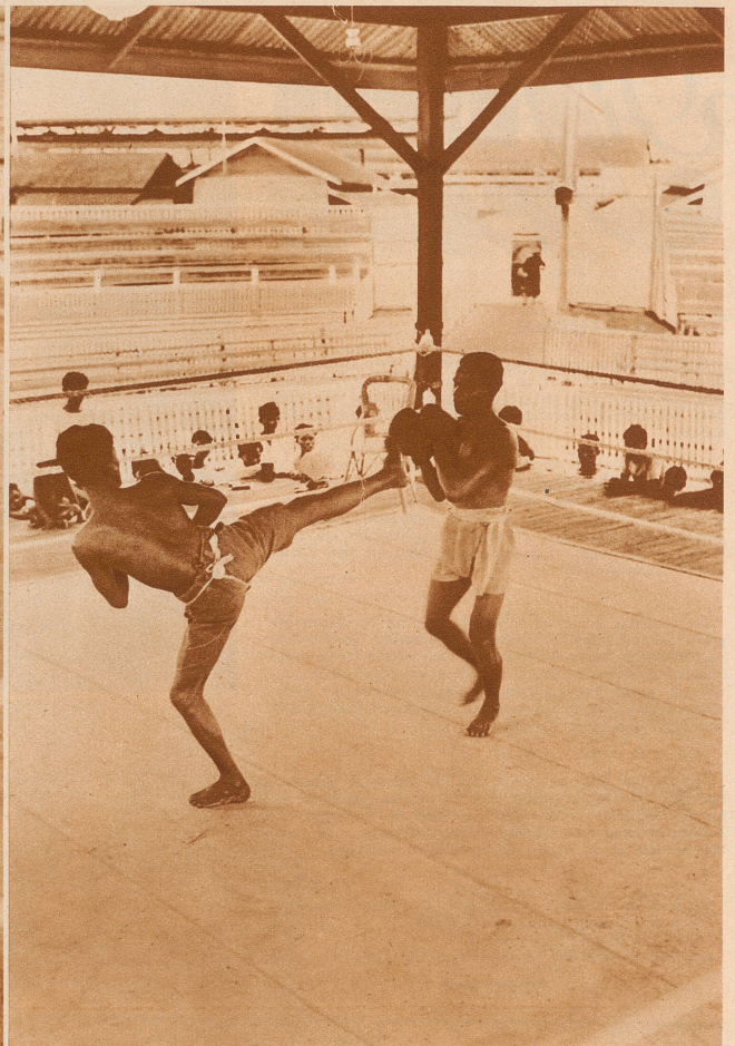
Der siamesische Boxkampf ist wesentlich verschieden vom dem unserigen. Alles ist dem Angreifer und dem Verteidiger erlaubt. Fußtritte in den Magen, ins Gesicht des Gegners sind da so geläufig, wie bei uns ein Kinnhaken