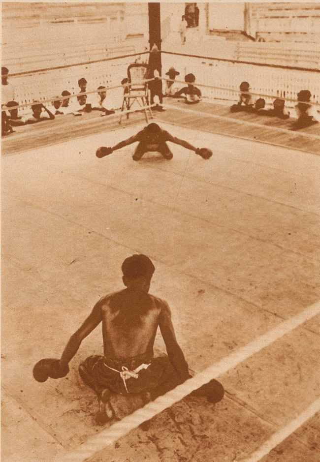
Vor dem Beginn des Kampfes beten die beiden Boxer zu ihrem Schutzpatron und bitten um den Sieg über ihren Gegner. Dabei führen sie einen Tanz auf, in welchem sie dem Schutzpatron zeigen, auf welche Art sie den Gegner besiegen wollen