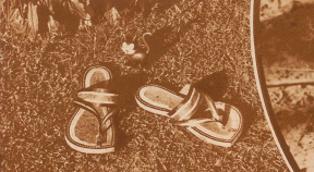
Erstlichend gerandete und gefornne sind einfruchtliche Sande