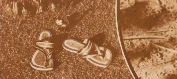
Entscheidend gemacht und gefahren sind einfruchtbar indische Sandstrände