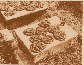
Und dabei belagerten Schwerekrüger, man begriffe die Ween dieses einstweilen Landes erst, wenn man seine heiligsten Seiten gesehen habe. Wie sind in einem Dorf bei Kultura. Die Sonne schwebt. Eine schwarze eingeborene Frau umfingter Kette hat den Daug heiliger Kette mit den Händen zu Kupfen gefüllt und so schweben zum Trostern auf abwärtsliche Stenowald geblieben. Die Fregatdrücke sind deutlich erkennbar. Eingegen allen europäischen Erwänden von Fyrene wird diese getrocknete Daug der als heilig verehrte Kall eine weltgewissen Königsgewand von Edgester und als wenderting Medizin verwendet