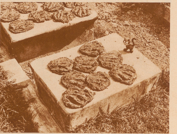
Und dabei belagerten Schwerekrüger, man begriffe die Ween dieses einstweilen Landes erst, wenn man seine heiligsten Sineser gesehen habe. Wie sind in einem Dorf bei Kultura. Die Sonne schwärzt. Eine schwarze eingeborene Frau unglückiger Kette hat den Daug heiliger Käse mit den Händen zu Kupfen gefüllt und so reibend zum Trocken auf abstrahlende Steinwölde geblasen. Die Feuertöpfe sind durch ein keram. Einengen alten europäischen Erwidern von Fiprene wird diese getrocknete Daug der als heilig verehrten Kälb aus weingewissen Kaugewürzen von Fipeneher und als weiderringer Medizin verwendet