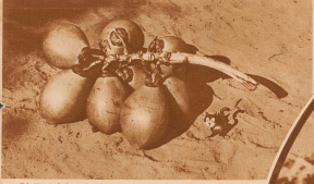
Die Kinnigokopplente bringt die schönsten Früchte ihrer Gattung hervor. Die prächtigen, wie die Beeren einer Traube aus dem Stiel aufgehängten Nüsse liegen im Uferlande eines europäischen Frassens. Der eingeborene Träger hat sie auf den Boden gelegt, da er ein Weibchen auf die Fährte zu warten hat, die mit leuchtenden Bänderklagen zum anderen Ufer übersetzt