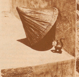
Wie der Tropenher aussteht, sind wir im Geben der besten Güter der Erde. Selbst die eingeborenen auf Ceylon verarbeitete eine Kaffeebohne nach. Dieser prächtige gebohrte Kaffeebohnen steuert rasch gegen Sonne und Regen