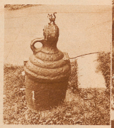
Frucht in Java! Ein Bild, wie wir es aus für Europa noch besser denken können! - Die einwärts geführten barocken Kanonen sind zur Nähe gekommen und haben hier in Batavia eine zweckmäßige Verwendung als Sandsperrwerke gefunden!