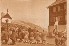
Für die glückliche Überwinterung der Herde wird im Schafsonntag auf Belalp im Freien eine Dankes-Messe abgehalten