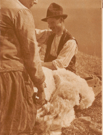
Ein Schaf von der Belalp bei der Scher. Die Tiefe der Schafschur vermittelt einen guten Begriff von der Dicke der Wölle dieser Wälder