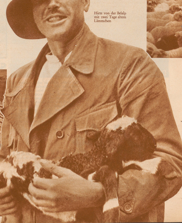
Hier von der Belalp mit zwei Tage alten Lämmern