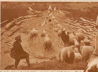
Das Bad im Bergete. Bevor die Schafe geschoren werden, wird die Herde zur Wäldle der Riet in die Bergete getrieben. Eine etwa stündliche Schaf-Wäldle vollzieht sich nicht ohne Widerstand der Tiere. Als erster muß immer der Leibknecht im Wasser sein. Ihm folgt dann die Herde, durchschneidet die See, und nicht so rasch als möglich die jenseitige Ufer zu erreichen, um dem nassem Elemente zu entziehen