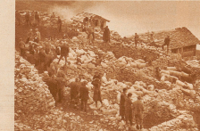
Ring um den großen Gemeindefestabend zieht sich ein Ring kleinerer «Familienfesten», in welche die angeschickerten Schafe durch den Verkauf werden. Hier bleiben sie bis zu ihrem Gang ins Bad und zur Scher