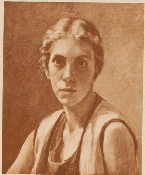
Oelgemälde von Alfred Marxer:

Eine Verlosung gibt jedermann die Hoffnung, für bescheidenes Geld ein Bild zu gewinnen. Plastik, Oelbilder, Aquarelle, Zeichnungen, graphische Blätter warten auf Liebhaber, die es sich leisten können, sich selbst zu beschenken und anderen zu helfen.