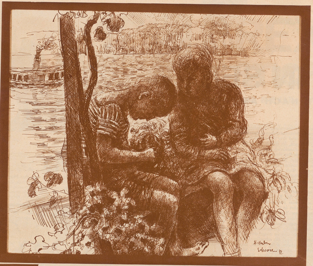
Federzeichnung von Hermann Huber: